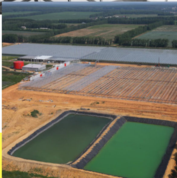
СТРОИТЕЛЬСТВО РЕЗЕРВУАРА ТЕХНИЧЕСКОЙ ВОДЫ НА ОБЪЕКТЕ ТЕПЛИЧНЫЙ КОМБИНАТ В П. САДОВЫЙ Г. ЕКАТЕРИНБУРГ