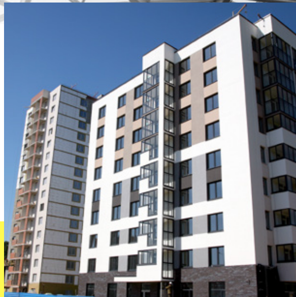
ЖИЛОЙ КОМПЛЕКС "РИФЕЙ" ПК 19 Г. ВЕРХНЯЯ ПЫШМА, УЛ. МАЛЬЦЕВА, 3 СДАН IV-Й КВАРТАЛ 2017 Г.