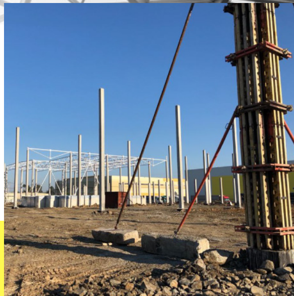
СКЛАДСКОЙ КОМПЛЕКС КЛАССА "А" Г. ЕКАТЕРИНБУРГ, ПОС. КОЛЬЦОВО, УЛ. ИСПЫТАТЕЛЕЙ ВЕДУТСЯ РАБОТЫ, СДАЧА IV КВ. 2018 Г.