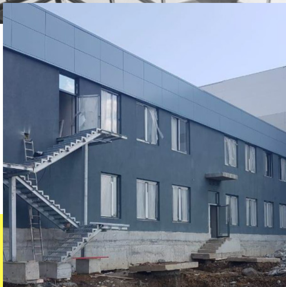
СКЛАДСКОЙ КОМПЛЕКС КЛАССА "А" Г. ЕКАТЕРИНБУРГ, ПЕРЕУЛОК 2-Й СИСТЕМНЫЙ, СТРОЕНИЕ 7/1 ВЕДУТСЯ РАБОТЫ, СДАЧА ОКТЯБРЬ 2018 Г.