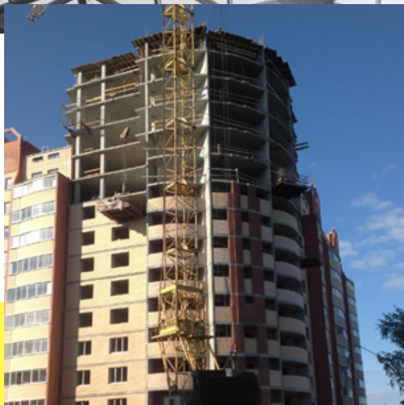
МНОГОЭТАЖНЫЙ ЖИЛОЙ ДОМ (СЕКЦИЯ 1Е) В ГРАНИЦАХ УЛИЦ ВОССТАНИЯ-МОЛОДЁЖИ-ДОСТОЕВСКОГО В ОРДЖОНИКИДЗЕВСКОМ РАЙОНЕ Г. ЕКАТЕРИНБУРГА