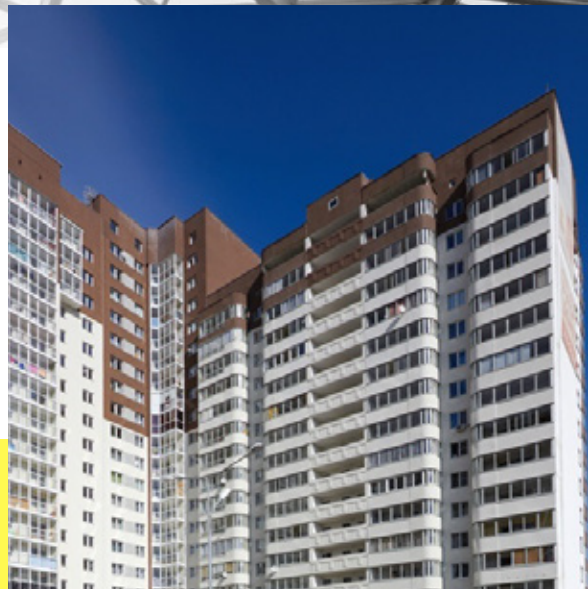
ЖИЛОЙ КОМПЛЕКС "СЕРЕБРЯНАЯ ПОДКОВА" Г. ЕКАТЕРИНБУРГ, ПЕР. РЕМЕСЛЕННЫЙ, 6 СДАН IX-2014 Г.