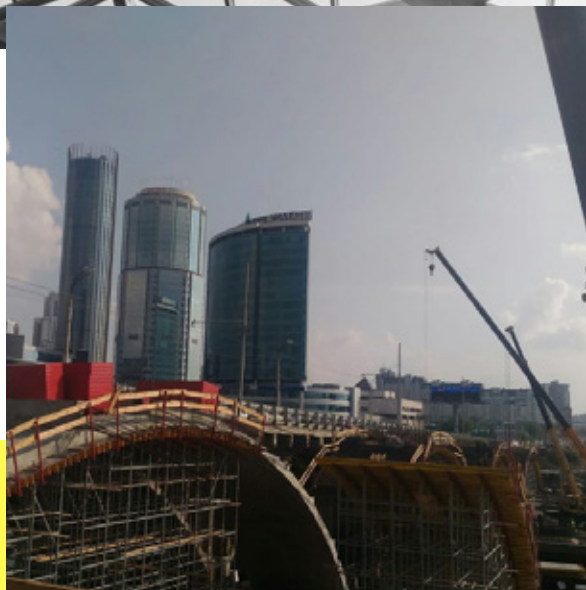
АВТОМОБИЛЬНЫЙ МОСТ / ПЕШЕХОДНЫЙ МОСТ Г. ЕКАТЕРИНБУРГ, МОСТ ЧЕРЕЗ РЕКУ ИСЕТЬ ПО УЛИЦЕ ЧЕЛЮСКИНЦЕВ ВЕДУТСЯ РАБОТЫ, СДАЧА IV КВ. 2018 Г.