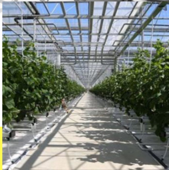
ВТОРОЙ БЛОК ТЕПЛИЧНОГО КОМБИНАТА В П. САДОВЫЙ Г. ЕКАТЕРИНБУРГ (ГЕНПОДРЯДЧИК – ООО «ЕГСК»)