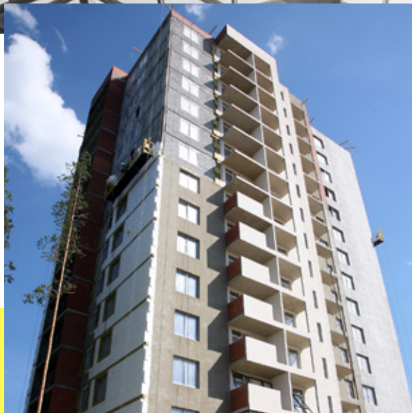
ЖИЛОЙ КОМПЛЕКС "РИФЕЙ" ПК 25 Г. ВЕРХНЯЯ ПЫШМА, МАШИНОСТРОИТЕЛЕЙ, 19 СДАН IV-Й КВАРТАЛ 2017 Г.