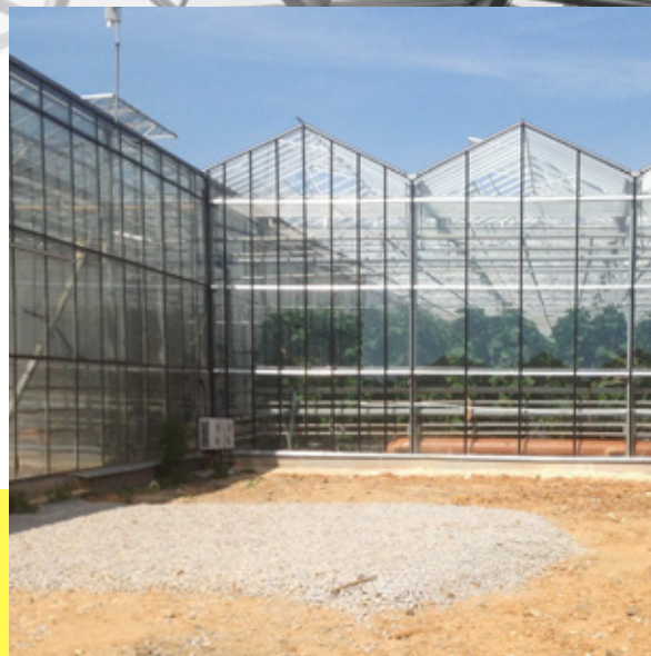
СТРОИТЕЛЬСТВО ТЕПЛИЧНОГО КОМБИНАТА ПРОИЗВОДСТВЕННОЙ ПЛОЩАДЬЮ 12 ГА В П. САДОВЫЙ Г. ЕКАТЕРИНБУРГ 5 ОЧЕРЕДЬ СТРОИТЕЛЬСТВА (ГЕНПОДРЯДЧИК – ООО «ЕГСК»)