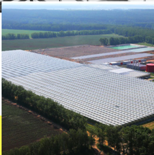
ТЕПЛИЧНЫЙ КОМБИНАТ В П. САДОВЫЙ Г. ЕКАТЕРИНБУРГ ПЛОЩАДЬЮ 12 ГА (ГЕНПОДРЯДЧИК – ООО «ЕГСК»)